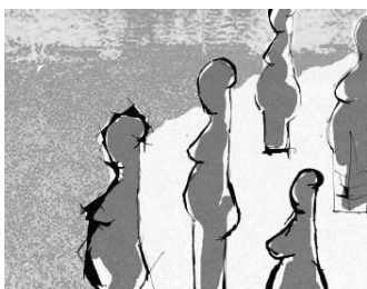
Skizze Petra Waldek

Zur Kennzeichnung und Abrundung der Kunstmeile sind Distanzanzeiger geplant. Das Projekt Kunstmeile soll weiter wachsen, zu einem Ganzen werden und die Wege entlang des Liesingbaches erlebbar machen. Für das Projekt wurde ein Förderansuchen an die Stadt Wien gerichtet.